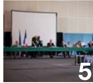
Fabien Aufrechter Maire de Verneuil-sur-Seine