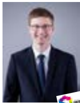
Fabien Aufrechter Maire de Verneuil-sur-Seine