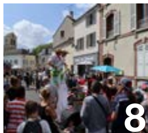
Fêtes de Verneuil, les inscriptions c'est maintenant !

Maire de Verneuil-sur-Seine Président de la Communauté urbaine Grand Paris Seine & Oise