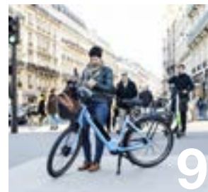
Demain j'achète un vélo électrique !