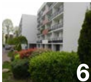
La résidence Delapierre, un havre en cœur de ville