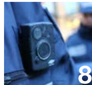
La Police municipale s'équipe de caméras embarquées