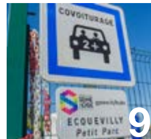
La vallée de la Seine à coups de pédale