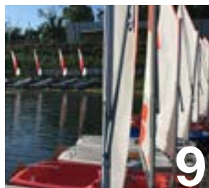
Le centre nautique fait peau neuve

Maire de Verneuil-sur-Seine Président de la Communauté urbaine Grand Paris Seine & Oise