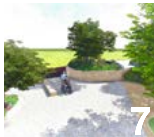
Le parc Saint-Martin fait peau neuve

Maire de Verneuil-sur-Seine Président de la Communauté urbaine Grand Paris Seine & Oise