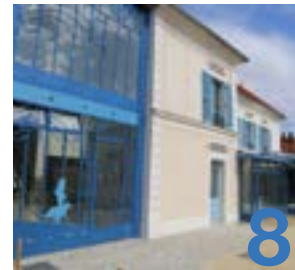
Un nouveau lieu dédié à la culture et aux arts