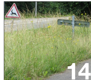
Tonte tardive, protéger la biodiversité