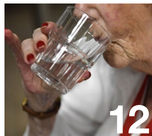
Fortes chaleurs, pour un été serein

Maire de Verneuil-sur-Seine Président de la Communauté urbaine Grand Paris Seine & Oise