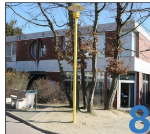
Un nouveau décor pour l'Espace jeunes