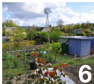
Un trophée pour nos jardins partagés

Maire de Verneuil-sur-Seine Président de la Communauté urbaine Grand Paris Seine & Oise