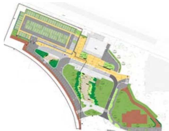
Document de travail Projet aménagement du Pôle gare

Le parcours sport-santé : grand gagnant de la première édition du budget participatif lancé par la commune l'an passé, le parcours sport-santé verra prochainement la jour dans le bois régional de Verneuil. Alliant de nombreux modules de renforcement musculaire ou adaptés à une pratique cardio-fitness, l'ensemble des ces équipements parsemés à travers le bois, seront posés avec des techniques de préservation complète de leur environnement.