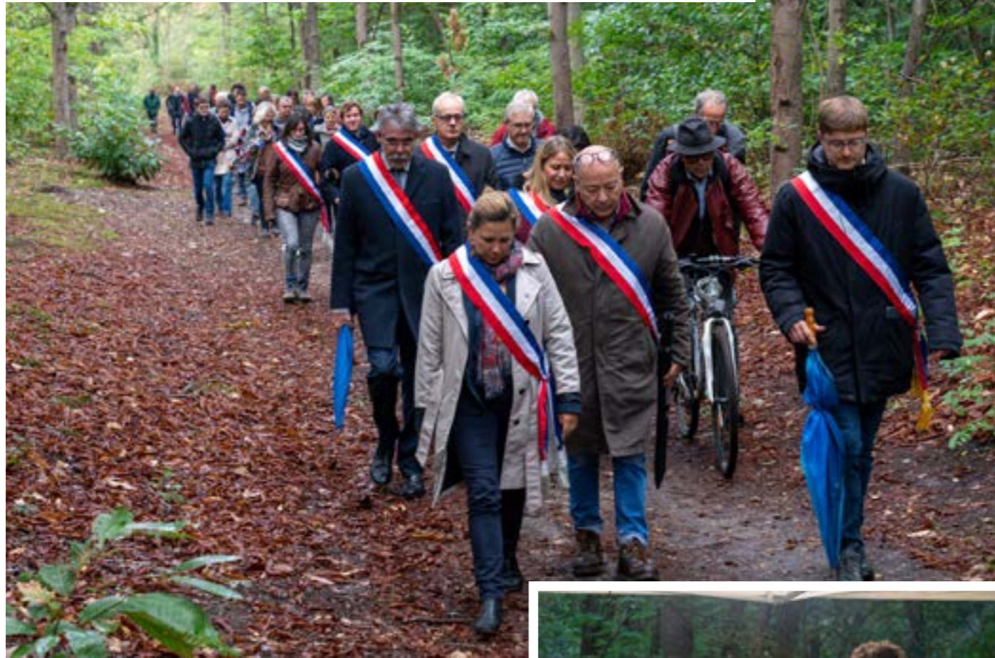
Les élus du conseil municipal ont tenu une réunion extraordinaire dans les bois le 27 septembre pour faire le point sur la situation relative au projet départemental de contournement de la RD 154.